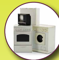
Déchets d'équipement électriques et électroniques