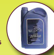
Huiles usagées (de friture et de vidange)