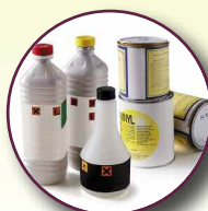
Déchets dangereux (peintures, aérosols, radiographies...)