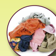
Textiles (vêtements et chaussures)