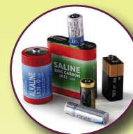
Piles, accumulateurs, batteries