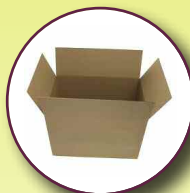
Cartons Merci de les aplatir