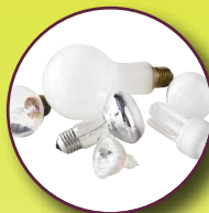
Ampoules et néons