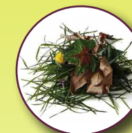
Déchets végétaux (taille de haies, tonte de jardin,...)