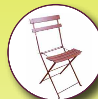
Ferraille cadre de vélo, grillage, mobilier en ferraille