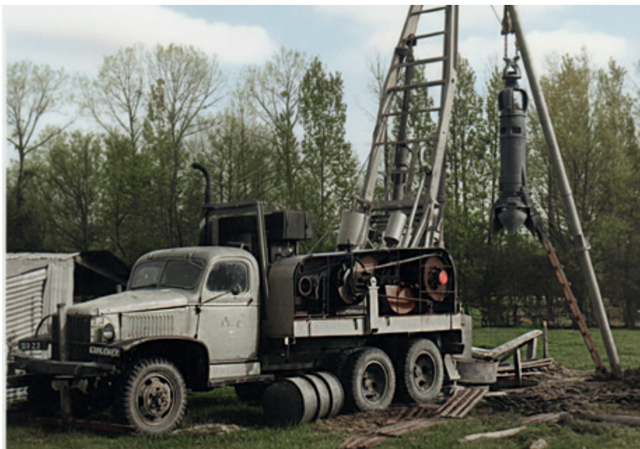
Forage du premier puit à la Thirboudière