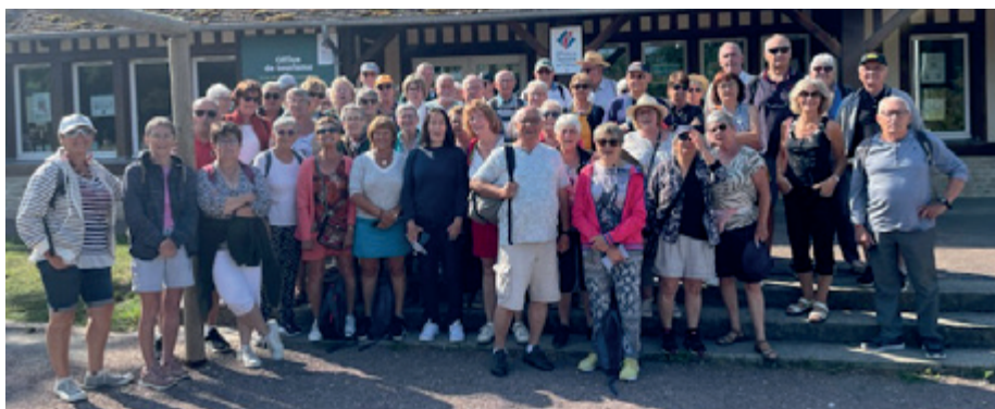
Groupe de BEUVRON EN AUGES juin 2025