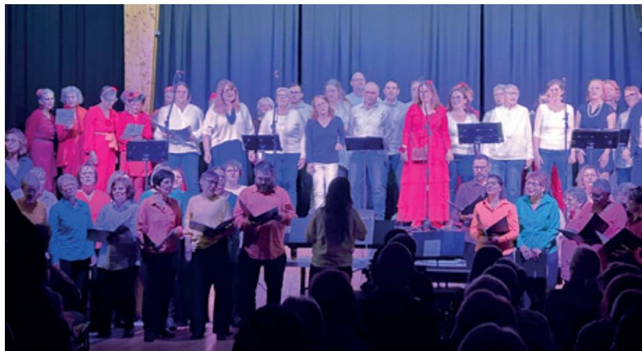
Festival Inter chorales à Pontvallain

Notre association propose tout au long de l'année une large palette d'activités artistiques ouvertes à tous : danse modern-jazz, chant choral, atelier chant, arts graphiques, mais aussi des ateliers collectifs de sophrologie.