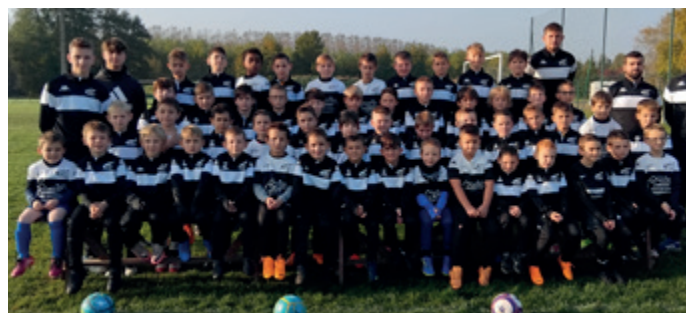
École du foot

Pour tout renseignement d'inscription (seniors, jeunes, dirigeants ou bénévoles), veuillez contacter le 06 79 52 58 55