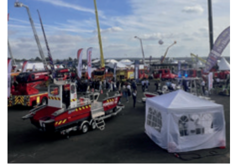
131 ème Congrès des Sapeurs-Pompiers au Mans