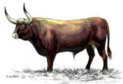
Illustration E. LE BRUN

Ainsi, bien loin des « fake news » évoquées en 1947, l'auroch de Pontvallain reste l'un des plus beaux témoignages préhistoriques de notre région — et une page d'histoire que l'on aime encore raconter.