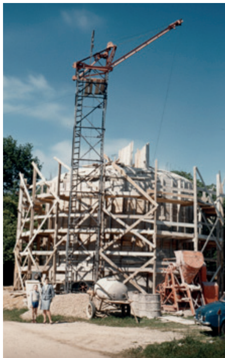
Château d'eau de l'Hommeau

Mais ces équipements, pour solides qu'ils soient, ont désormais plus de six décennies d'existence. Les canalisations posées à l'époque atteignent leur limite d'usage, avec