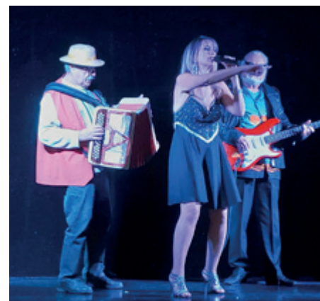
Spectacle autour d'un repas convivial

• Les services Enfance, Jeunesse, Famille , qui proposent des solutions adaptées pour vos enfants, notamment pendant les périodes de vacances.