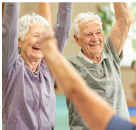
Atelier Gymnastique douce pour les seniors

Le CCAS (centre communal d'action social) de la Commune et son équipe seront présents comme en 2025, à vos côtés afin de vous accompagner au quotidien et essayer de répondre à vos besoins.