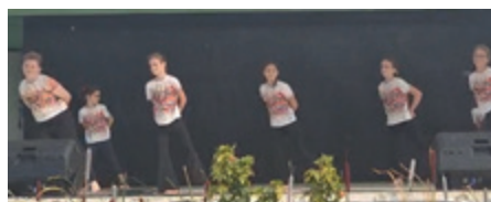
Spectacle "Famille" lors du comice agricole

Cette année, nous plaçons notre saison sous un thème inspirant : « Cap sur la couleur, bienvenue dans notre parenthèse pop ! ». Le ton est donc donné pour notre grand spectacle de fin d'année. Rendez-vous le dimanche 14 juin 2026 !