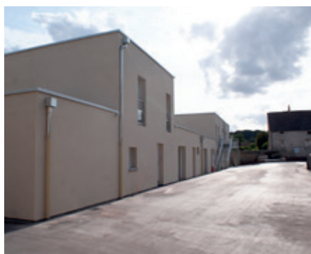
Les logements ont remplacé l'ancienne gendarmerie

La réfection du chemin de ronde a quant à elle été reportée pour des raisons liées à l'échéancier des travaux.