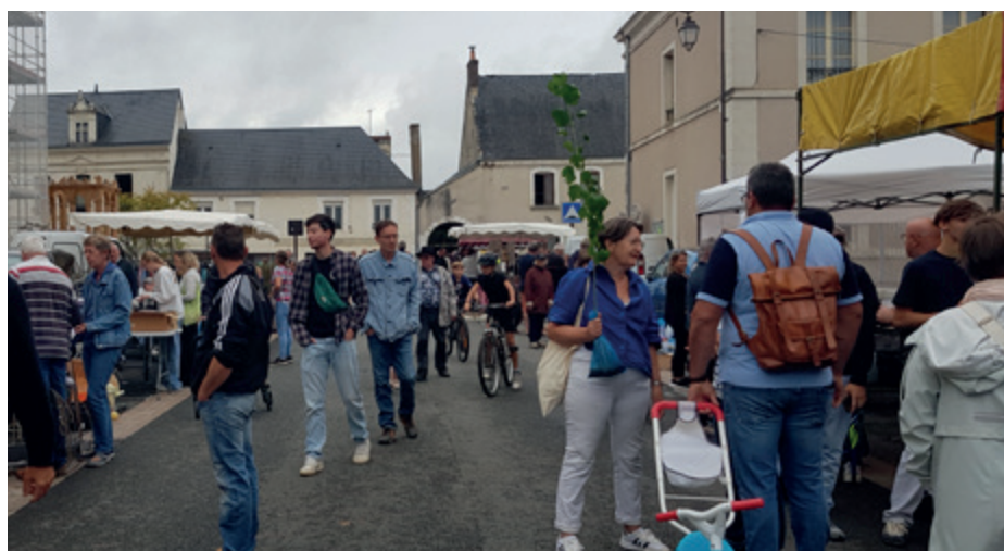
Bric-à-Brac Boulevard Dubois - Lecordier